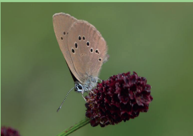
Dunkler Wiesenknopf-Ameisenbläuling

Über kurzfristige Änderungen des Programmes bzw. des Veranstaltungsortes informieren wir Sie auf unserer Homepage unter www.bund-naturschutz-passau.de